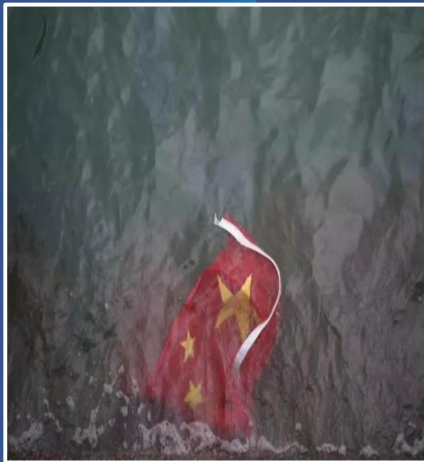
2019年香港发生修例风波后，极端激进分子扯下旗杆上的国旗扔入海中